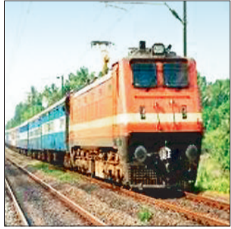
ट्वीट ईमेल भेज करारा बंद ट्रेन का स्मरण