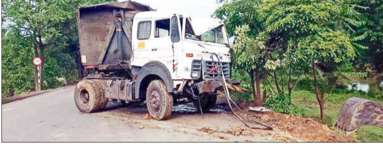
हरिभूमि न्यूज ►► रायगढ़

तमनार क्षेत्र में फ्लाईएश लोड गाड़ियों की तेज रफ़्तार और रफ़्तार और अधिक टिप लगाने के चक्कर और चंद पैसों के लालच में चालक लापरवाही पूर्वक तेज गति से फ्लाई एश लोड गाड़ियों से आए दिन दुर्घटना हो रही है। ज़िंदल से लेकर डोंगामहुआ तक की सड़क सबसे ज्यादा खतरनाक हो गई है। चौक चौराहों पर भी फ्लाईएश की गाड़ियां धीमी नहीं हो रही हैं। जिससे आए दिन ग्रामीण सड़क दुर्घटनाओं के शिकार हो रहे हैं। अभी कुछ दिन पहले ही हुंकारडिया चौक के पास एक घटना हुई। एक युवक पेट्रोल पंप की ओर से पेट्रोल डला कर सड़क किनारे पर था। तभी लिंबा की ओर से आ रही फ्लाईएश की गाड़ी ने बाइक को रौंद दिया। इसके बाद चौक में खूब बखेड़ा