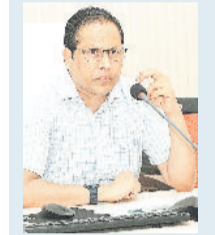
एक ही दुकान से इस और काँपी किताब खरीदने के लिए नहीं कर सकते बाध्य